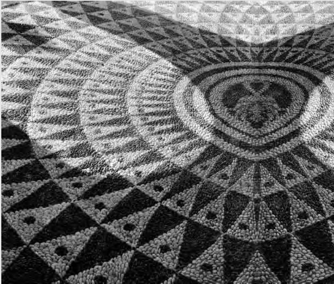
Mosaïque de galets (image inversée), Calli-thea, île de Rhodes.

souffrance. Au terme d'innombrables et amères expériences, il atteint une limite à partir de laquelle le cœur devient sensible aux impulsions d'un autre champ de vie. Une nouvelle force vitale, provenant d'un plan supérieur, coule dans le sang et monte jusque dans la tête, changeant ainsi certaines fonctions du cerveau. Il s'ensuit un nouveau mode de pensée dont le pouvoir discriminant n'est pas limité au seul domaine moral du bien et du mal : il distingue également le spirituel du naturel. Né de la force de la rose du cœur, ce pouvoir mental distingue les valeurs impérissables de celles qui ne le sont pas. Lorsqu'il se met au service du principe éternel dans le cœur, la seconde fonction s'éveille. L'aspiration du cœur à l'unité ne s'oriente plus sur la liaison avec d'au-