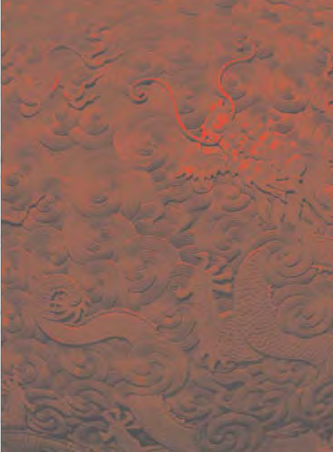
Coffret de laque. Bois sculpté. Chine, IXème siècle.

s'enregistre dans le sang. Au passage, le cœur perçoit l'information et la traduit en un certain état d'âme.