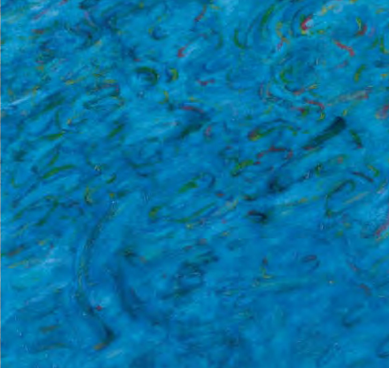
E. de Keizer. Sans titre (détail). Collection particulière.

Les lignes de force de l'objet se communiquent au sujet, au peintre lui-même. De cette expérience de l'unité, naît l'œuvre d'art ; elle fait irruption dans un vertige inconnu. L'artiste a déjà oublié ses tourments et ses luttes. Les œuvres abouties restituent quelque chose de vivant et donnent l'impression d'avoir été réalisées rapidement et avec facilité.