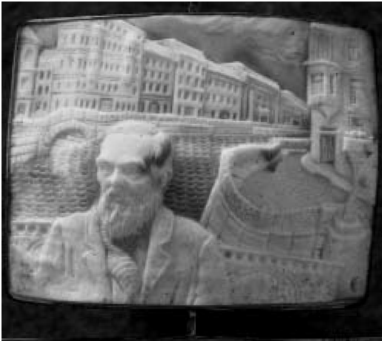
Portrait de Dostoïevski (camée, St Pétersbourg).

ner dans le champ de vie divin, le monde de l'homme originel. Tous ceux qui en découvrent le chemin se rendent bien compte qu'on ne s'occupe, en général, que du côté extérieur des choses... et combien eux-mêmes, pendant longtemps, n'ont examiné et jugé que ce côté-là. Le moi ne se connaît pas lui-même, ni ne pénètre le moi des autres. Des forces puissantes, et rapidement changeantes, constituent la vie et la société. Elles suscitent peur et incertitude. La matière, ainsi que les idées et sentiments qu'elle génère, forment un voile pour ainsi dire impénétrable qui sépare l'être humain de la réalité divine. Le plan divin ne prévoit pas de se concilier cette forme d'existence. Etant donné que l'homme doit faire croître le germe de son âme éternelle, au cours d'une incessante confrontation avec le monde impitoyable des forces contraires, il n'a pas intérêt à changer les pierres en pain. Combien cela semble difficile, même aux yeux du Grand Inquisiteur! La Lumière appelle sans cesse à l'éveil, à la connaissance de soi et du monde, et surtout au retour dans le monde divin.