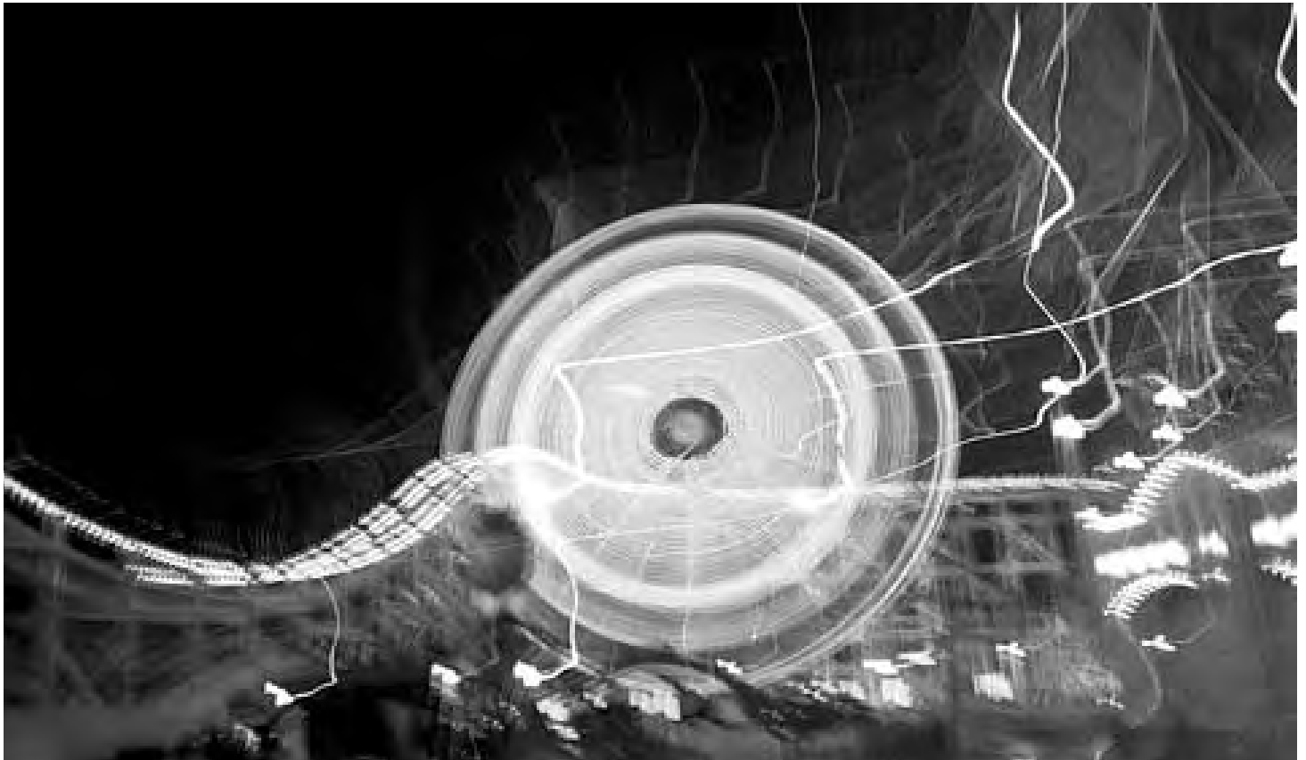
Jamais ne s'arrête la roue de la vie... prise de vue nocturne d'une autoroute en Angleterre