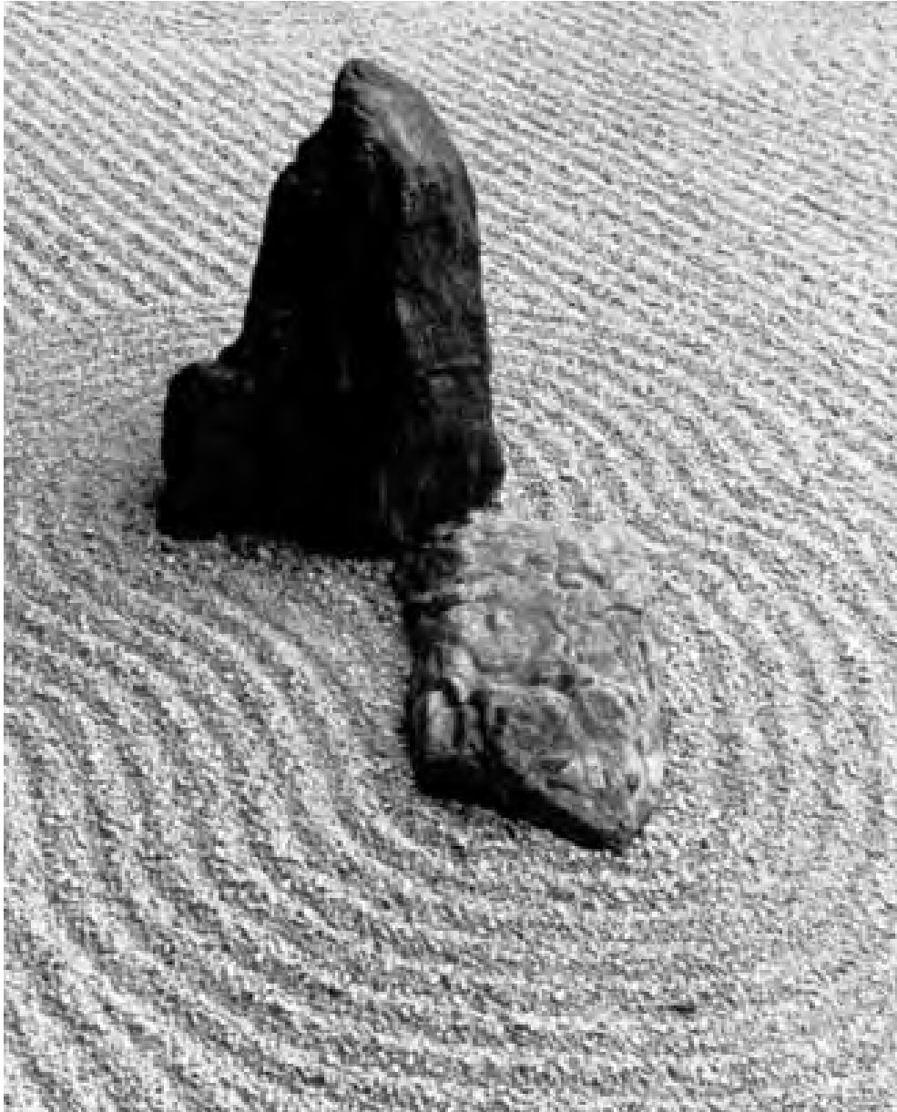
Dévouement et persévérance : en chemin vers l'équilibre intérieur

en songeant qu'un tel feu flambant devrait avoir consumé en quelques secondes le fameux buisson.