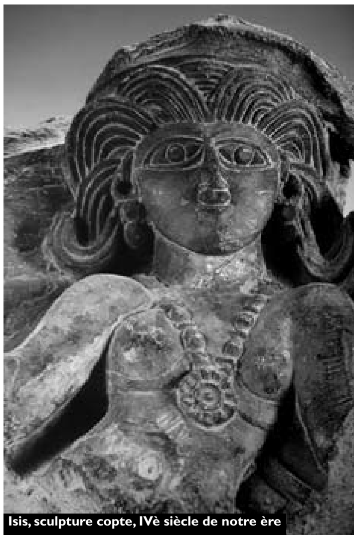
Isis, sculpture copte, IV e siècle de notre ère

S'il y a une chose dont le monde a besoin au début de l'ère nouvelle, c'est bien d'hommes et de femmes témoignant d'une véritable vie spirituelle, autrement dit d'une vie animée par l'esprit, attitude qui se manifeste parfois d'une manière subtile dans la façon de résoudre les problèmes ou de parler et d'agir.